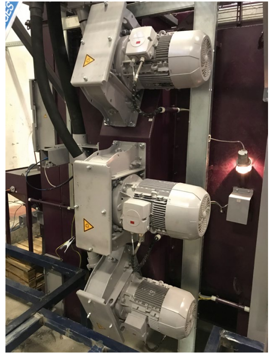
↑ Turbiny AGTOS z częściami zużywającymi się wykonanymi z twardego metalu wysokoodpornego na zużycie.