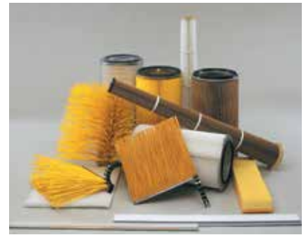
Oprócz części do turbin dostarczamy wkłady filtracyjne, nowe szczotki do czyszczenia, szczotki uszczelniające a także części gumowe i z manganu dla wielu typów maszyn.