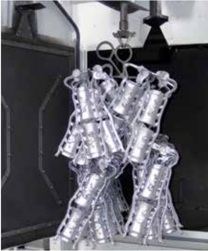
Formy do odlewów po procesie strumieniowania.