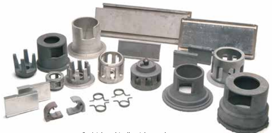
Części do turbin dla wielu marek maszyn.