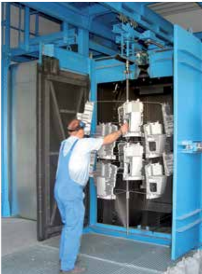
Oczyszczarka strumieniowa zawieszkowa HT-17-23 AGTOS.