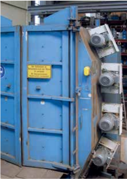
Turbiny AGTOS często są stosowane do zwiększenia wydajności starszych oczyszczarek strumieniowych, tutaj przykład oczyszczarki z transportem zawieszkowym.