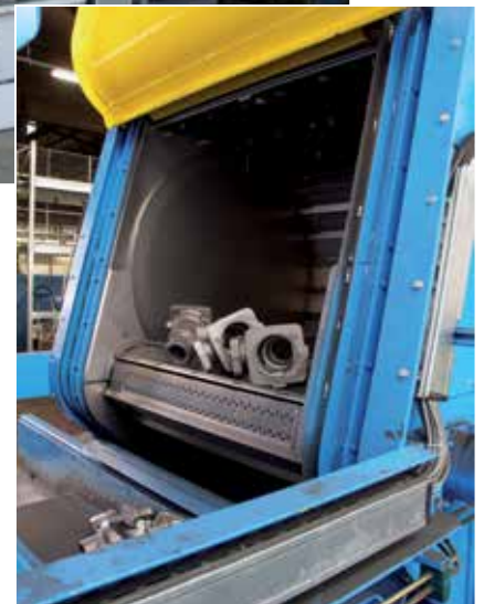
Elementy kuźnicze w oczyszczarnie strumieniowej z przenośnikiem gąsienicowym.

Oprócz oczyszczarek strumieniowych wszelkiego typu projektujemy i dostarczamy kompletne urządzenia wraz z tunelami chłodzącymi, systemami transportowymi i stanowiskami szlifierskimi. Ponadto oferujemy maszyny używane, serwis i części zamienne.