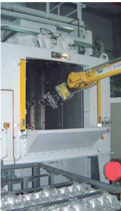
Zautomatyzowana oczyszczarka strumieniowa ze stołem obrotowym i satelitami do czyszczenia odlewów.

Kwestie czyszczenia odlewów oraz strumieniowania form zajmują znaczące miejsce w technice obróbki strumieniowej. Posiadamy doświadczenie w tej dziedzinie.