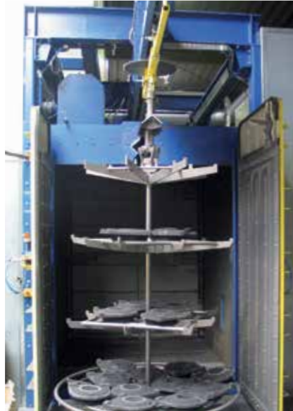
Elementy przed obróbką w przelotowej oczyszczarnie strumieniowej.