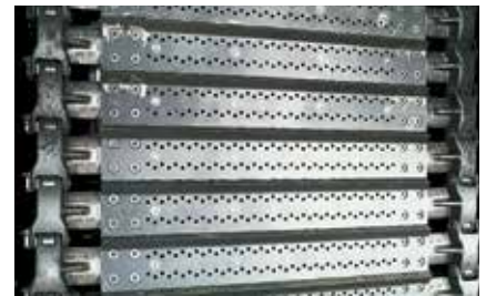
Wyposażenie maszyn z przenośnikiem gąsienicowym w nowe części technologicznego zużycia.