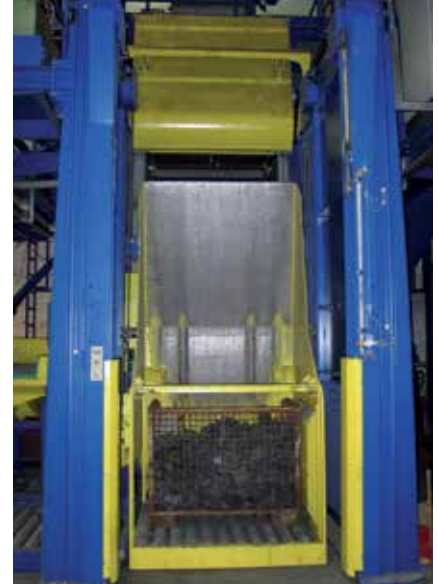
Oczyszczarka strumieniowa z przenośnikiem gąsienicowym MR-850 AGTOS.