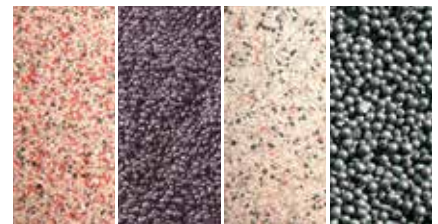
W krótkim terminie dostarczamy różne rodzaje ścierniwa.